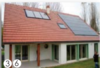
Breuil Sur Vesle Maison à énergie positive Samedi 26 juin à 15h Samedi 16 octobre à 15h

Un courrier ou mail vous sera envoyé avec les indications d'accès quelques jours avant les visites.