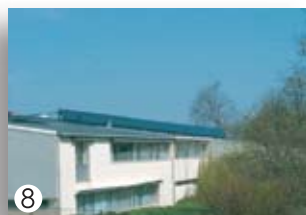
Blacy Panneaux solaires thermiques et pompe à chaleur aérothermique Vendredi 3 décembre à 14h30