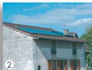
Courtisols Panneaux solaires thermiques et photovoltaïques Samedi 19 juin à 11h