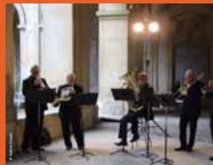
>> Marché aux truffes, édition 2012 - Animation musicale

Ce marché est organisé par l'Association marnaise des producteurs de truffes et avec le soutien de la Ville de Reims.