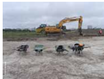
>> Fouille sur la ZAC de Bezannes au lieu-dit « Le Champ Drillon », juillet 2012

Les nombreuses opérations archéologiques menées ces dernières années sur l'emprise de la ZAC de Bezannes permettent désormais aux archéologues d'esquisser l'évolution de ce territoire depuis l'époque néolithique. Cette conférence vise à en présenter les premiers résultats en s'appuyant sur quelques-unes de ces fouilles.