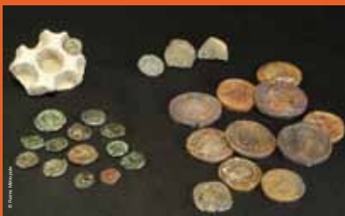
>> Moule à flan, moules monétaires, monnaies d'époques galloise, gallo-romaine et médiévale

A l'issue de la découverte et démonstration des processus de frappe des monnaies au marteau, chaque visiteur se verra remettre la copie d'une monnaie exposée dans le cadre d'« Éléments Terre ». En quête de découvertes archéologiques ».