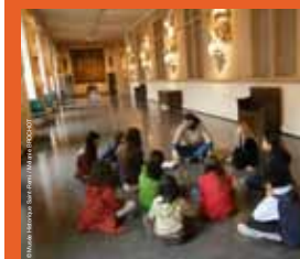
>>> Découverte ludique pour le jeune public