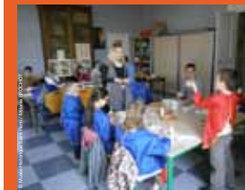
>>> atelier pour le jeune public