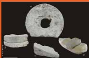
>> les outils de la mouture. 1 et 2 : meules à va et vient avec molette. 3 : méta et castilus de meule rotative, 4 : castilus