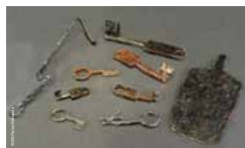
>> Divers types de clés et pelle domestique d'époque romaine, provenant des fouilles du service archéologique de Reims Métropole