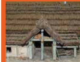
>>> Habitat rural mérovingien (maquette), VI e -VII e siècles