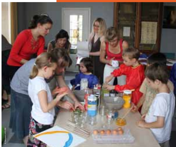
>> atelier pour les familles

Jeudi 31 octobre 2013 9 h 30 - 11 h 30 Enfants de 5 à 8 ans accompagnés d'un adulte