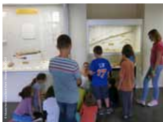
>>> visite ludique dans la salle de préhistoire pour les 8/12 ans