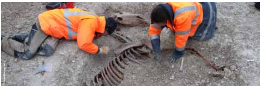
>> Fouille fine d'un cheval en connexion, encore partiellement ferré et aux pattes attachées par un fil barbelé, probablement contemporain à la Grande Guerre, Bezannes, 2010

Un événement au Musée Historique Saint-Remi !