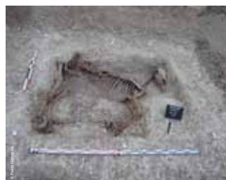
>> Squelette de cheval de la Grande Guerre découvert à Bezannes « La Bergerie »

Présentation des fouilles menées par le Groupe d'études archéologiques Champagne-Ardenne dans le quartier Saint-Remi.