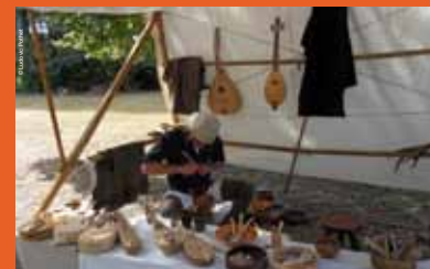
>> atelier de lutherie médiévale

Cette technique de peinture était fortement utilisée au Moyen Âge. Les visiteurs en découvriront les astuces et pourront eux-mêmes créer leur peinture à la manière des artistes médiévaux.