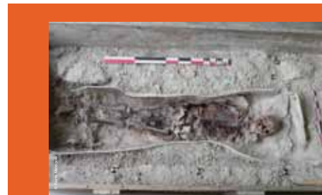
>> Sarcophage en plomb, découvert à Bezannes, en cours de fouille, septembre 2010