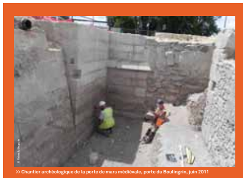
>> Chantier archéologique de la porte de mars médiévale, porte du Boulingrin, Juin 2011