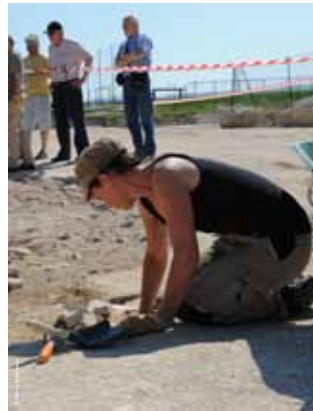
>> Journée portes ouvertes sur la fouille « Le champ Drillon » de la Zac de Bezannes, octobre 2012

Bétheny du 7 au 11 octobre inclus St Brice Courcelles du 14 au 21 octobre inclus Cernay les Reims du 21 au 25 octobre inclus Champigny du 28 octobre au 4 novembre inclus Puisieux du 4 au 15 novembre inclus Cormontreuil du 4 au 15 novembre inclus Trois Puits le 18 novembre Bezannes du 25 au 29 novembre inclus Sillery du 2 au 6 décembre inclus Taissy/St Léonard du 2 au 6 décembre inclus Villers aux Nœuds du 18 décembre 2013 au 6 janvier 2014 inclus Prunay du 6 au 20 janvier 2014 inclus Tinqueux du 17 au 24 janvier 2014 inclus