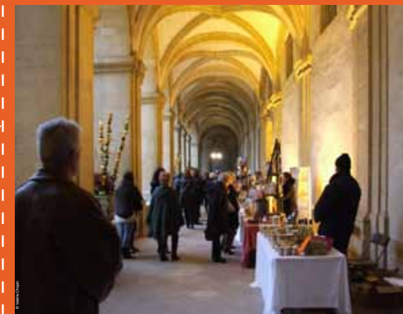
>> Marché aux truffes, édition 2012 - Producteurs « La Bergerie »