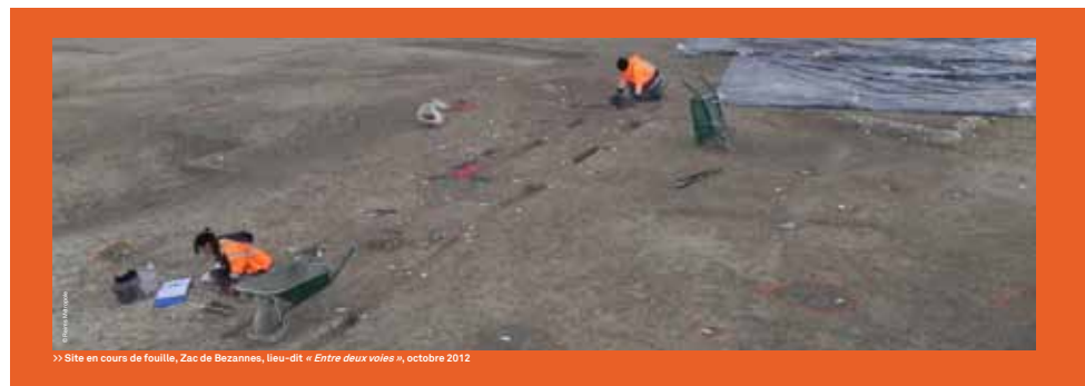
>> Site en cours de fouille, Zac de Bezannes, lieu-dit « Entre deux voies », octobre 2012