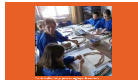
>>> réalisation de tympan en argile par les enfants

Pour les visites et ateliers, en partenariat avec Cultures du Cœur : réservation obligatoire auprès de Cultures du Cœur au 03 26 88 43 89 ou par mail à cdc51@wanadoo.fr