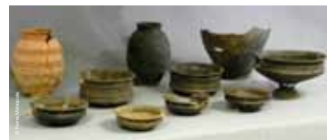
>>> Ensemble de céramiques associé à une sépulture, Bezannes Le Haut Torchant