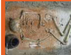
>>> Sépulture d'un jeune homme, vers 4500 av. J-C