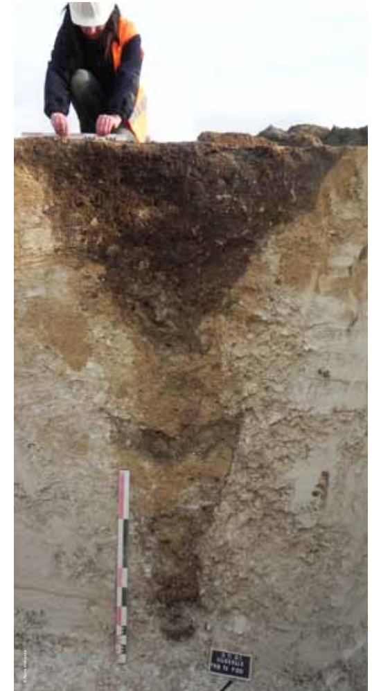
>> Fosse à profil en Y, Bétheny « Parc d'activité de la Hussele »

Par Nicolas Garmond et Frédéric Poupon, responsables scientifiques d'opération au Service Archéologique de Reims Métropole.