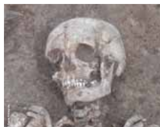
>> exemple d'individu féminin inhumé avec une fibule, Châlons-en-Champagne «28-32 rue du Général Féry».