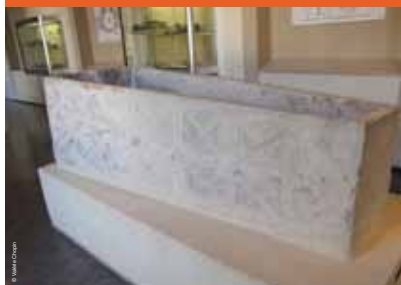
>> Sarcophage mérovingien, VIII e siècle

Pour l'ensemble des ateliers et animations : réservation obligatoire auprès du service des publics au 03 26 35 36 91 ou par mail à angele.lavit@mairie-reims.fr